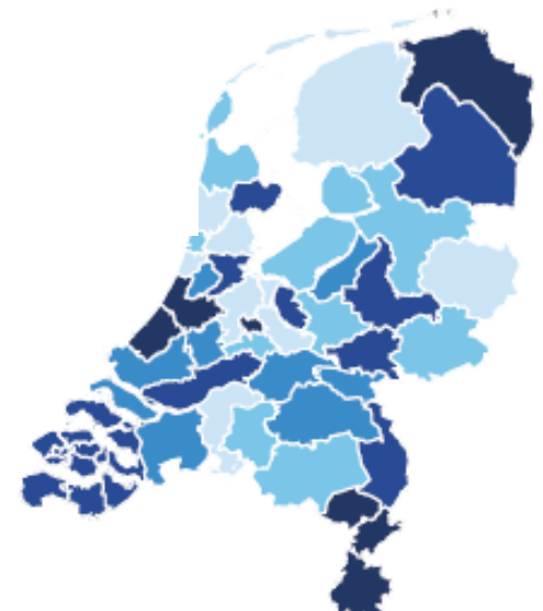
42 regio's voor jeugdhulp, jeugdbescherming en -reclassering