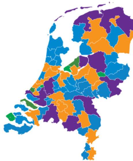
75 samenwerkingsverbanden voortgezet onderwijs